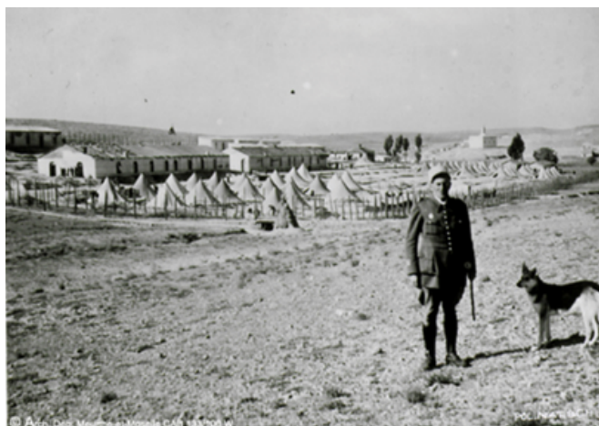
Camp d'internement de Djelf situé à 2000m d'altitude

À Leur arrivée ces hommes sont embarqués dans les cales d'un cargo le « Djebel-Nador » qui met le cap sur l'Afrique du Nord.