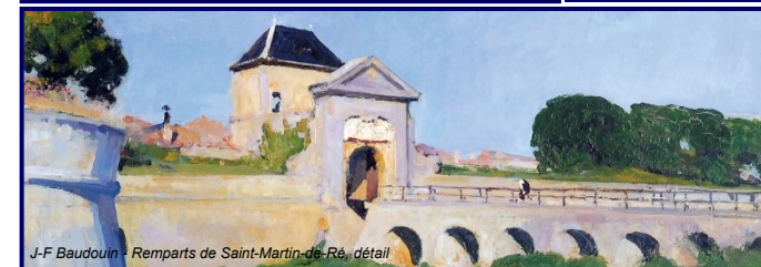
J-F Baudouin - Remparts de Saint-Martin-de-Ré, détail

Programme des ateliers du 11 février au 8 mars 2020