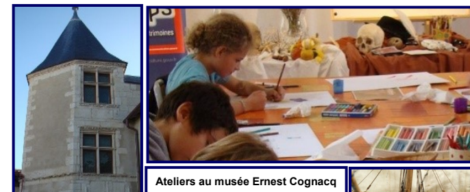
Ateliers au musée Ernest Cognacq